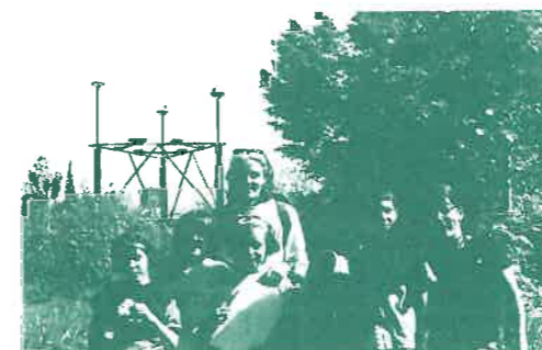
Actividad Medioambiental de fomento del conocimiento del los Bosques de Ribera. Colegio de Medrano

Para ecologistas en acción es imprescindible la elaboración de un catálogo de zonas húmedas que dicte una política de conservación y potenciación de estos ecosistemas, los más importantes en biodiversidad de nuestra Comunidad.